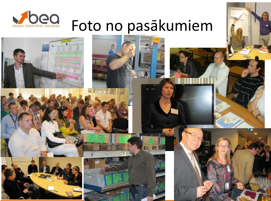
Foto no pasākumiem